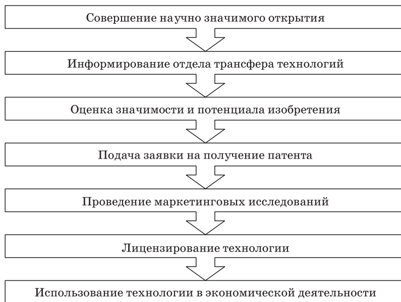
Рис. 3. Американская модель трансфера инновационных технологий [10] Fig. 3. The American model of transfer of innovative technologies

Сотрудники специального центра трансфера технологий определяют предприятия, где новая технология или изобретение может быть внедрена для коммерческого использования. Также данные сотрудники проводят документальное и правовое сопровождение и контролируют получение изобретателем платежей за использование инновационных технологий, скажем, в форме выплачиваемого роялти и иных формах [5].