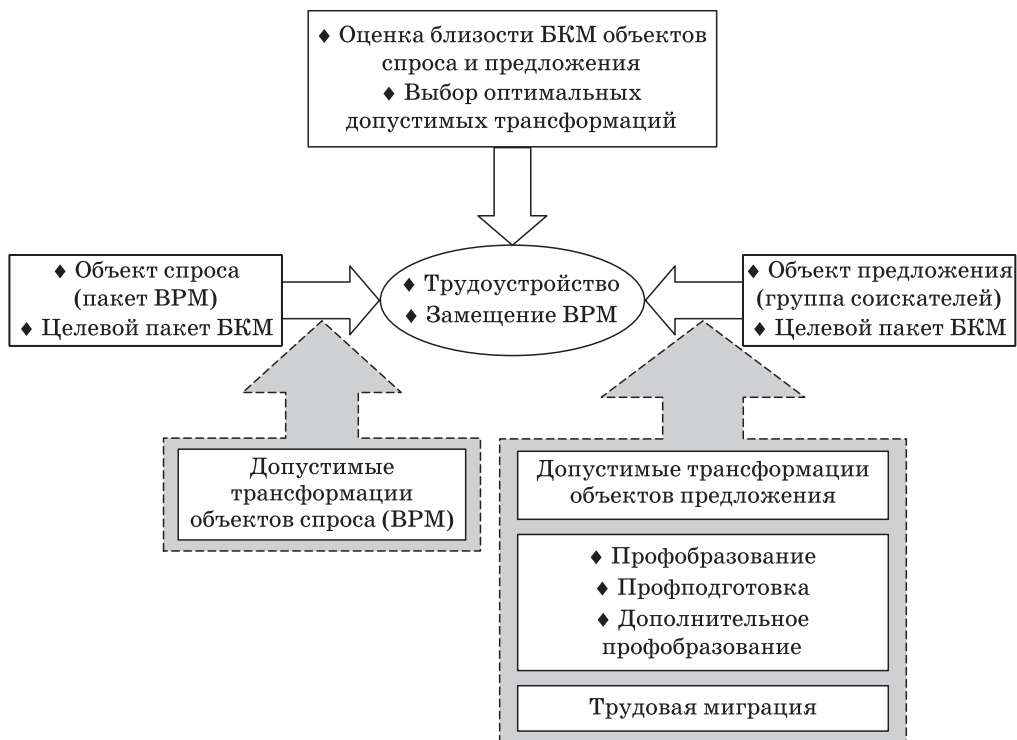
Рис. 1. Концептуальная схема взаимодействия объектов спроса и предложения Fig. 1. Conceptual scheme of interaction of objects of supply and demand

нального образования с решением задачи преобразования кадровой потребности из экономического формата в образовательный.