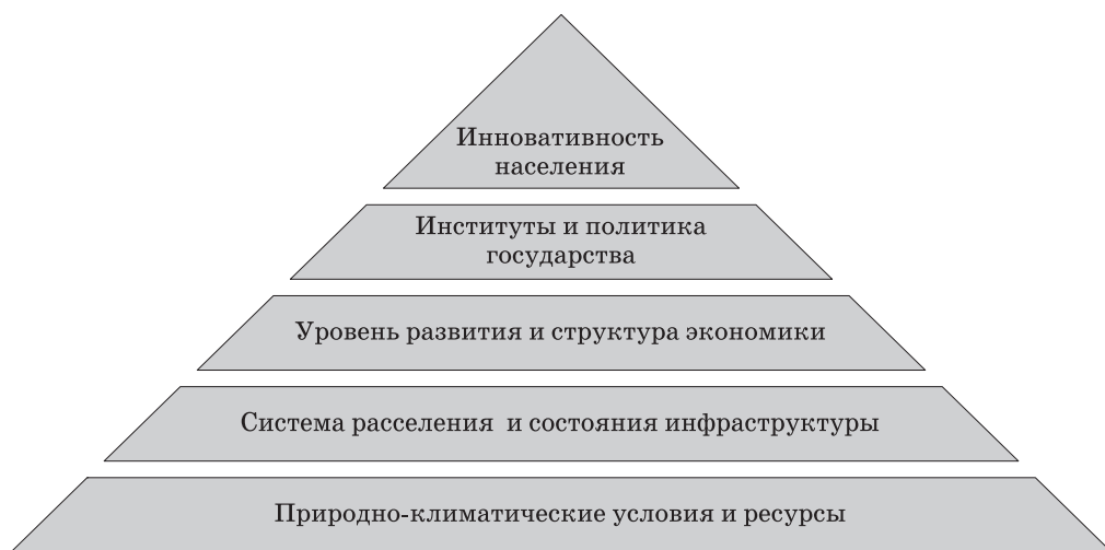
Рис. 1. Пирамида факторов регионального развития Fig. 1. Pyramid of regional development factors

ляется наличие конкурентного преимущества, это позволяет ускорить экономический рост, привлечь инвестиции, концентрировать высококвалифицированные трудовые ресурсы. Формирование конкурентного преимущества зависит от определенной среды и условий внутри региона. В рамках своей работы «Пирамида факторов социально-экономического развития регионов» [3, с. 125] д. э. н. О. В. Кузнецова предлагает концепцию формирования иерархичной системы факторов экономического и социального развития региона по принципу пирамиды Маслоу (рис. 1).